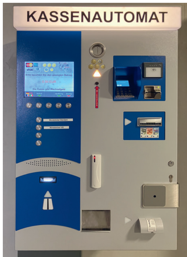
Abbildung 5 (oben): Ticketautomat

Verbreitet sind Kombinationen aus Ticket- und Kassenautomaten. Bei Einfahrt kann am Ticketautomaten anonym ein Papierticket gezogen werden (Abbildung 5), das vor Ausfahrt am Kassenautomaten (Abbildung 6) zu bezahlen ist. In den meisten Fällen ist am Kassenautomaten neben der Zahlung des unmittelbar genutzten Parkzeitraums (z. B. in Stunden oder Tagen) auch die Wahl längerer Gültigkeitsdauern (z. B. Wochen oder Monate) zur wiederkehrenden Nutzung möglich. Jahrestickets erfordern jedoch oft eine persönliche Identifikation beim Personal vor Ort oder einer Geschäftsstelle. Hierdurch können parallel sowohl identifizierbare als auch nicht identifizierbare Nutzende existieren. Dies kann ein Sicherheitsrisiko gerade für regelmäßige Nutzende mit Zeitkarten darstellen.