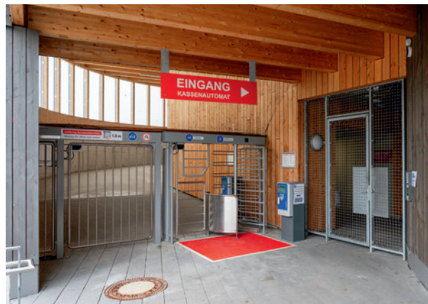
Abbildung 11: Drehkreuzanlage. Das Rad muss beim Einfahren links geführt werden. Separates Tor für Spezialräder, 1,5 m breit. Anschlagtür für Zugang ohne Rad.

Wie auch bei Nutzendenmanagement und der Zugangskontrolle gibt es keine universell gültige Lösung. Bei der Auswahl der passenden Türanlage ist neben einer einfachen und komfortablen Bedienbarkeit mit allen zu