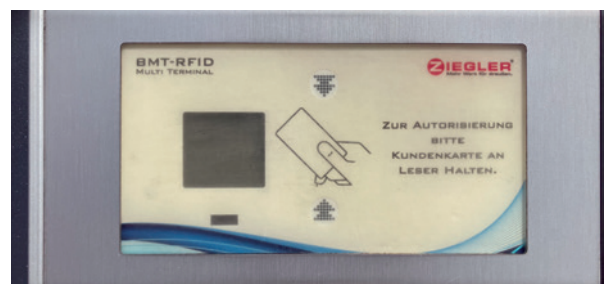
Abbildung 3 (oben): Parkberechtigung als Aufkleber am Fahrrad Abbildung 4 (unten): Kartenlesegerät für RFID-Karten