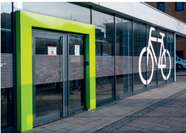
Abbildung 10: Anschlagtür mit Terminal zur Zugangskontrolle rechts

In der Praxis kommen eine Vielzahl unterschiedlicher Lösungen zum Einsatz, die je nach Anforderungen variieren: Diese reichen von einfachen, manuell zu öffnenden Anschlagtüren über Schiebetore, Drehkreuzanlagen, automatischen Glasschiebetüren oder Schiebedrehkreuze bis hin zu Schnellaufrolltoren oder Kombinationen aus mehreren Anlagenarten (Abbildung 10 bis Abbildung 17). Ziel bei der Auswahl geeigneter Türanlagen sollte eine möglichst hohe Attraktivität der Anlage sein, indem ein hoher Nutzungskomfort mit einem zugleich hohen Sicherheitsniveau für Nutzende und abgestellte Fahrräder kombiniert wird.