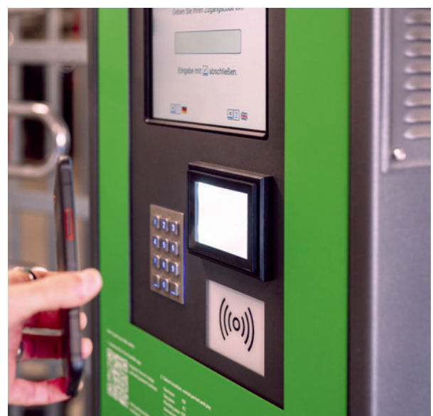
Abbildung 7 (oben): Terminal zur Zugangskontrolle mit unterschiedlichen Identifikationsmöglichkeiten – Identifikation mit PIN.