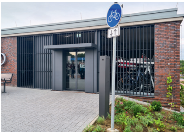
Abbildung 12: Automatische Glasschiebetür mit separater Terminal-Steuerung.

Die Herstellung einer ausgewogenen Balance aus Komfort und Sicherheit ist dabei häufig anspruchsvoll. In größeren Anlagen sind häufig Drehkreuzanlagen aus Metall vorzufinden. Bei diesen wird das Rad durch ein meist halbhohes, automatisch öffnendes Tor geschoben, während Nutzende parallel ein Personendrehkreuz passieren. Dieser Anlagentyp verspricht durch die Vereinzelungsfunktion und die robuste Bauweise ein hohes Sicherheitsniveau, erweist sich in der Praxis jedoch als wenig komfortabel und nicht intuitiv nutzbar.