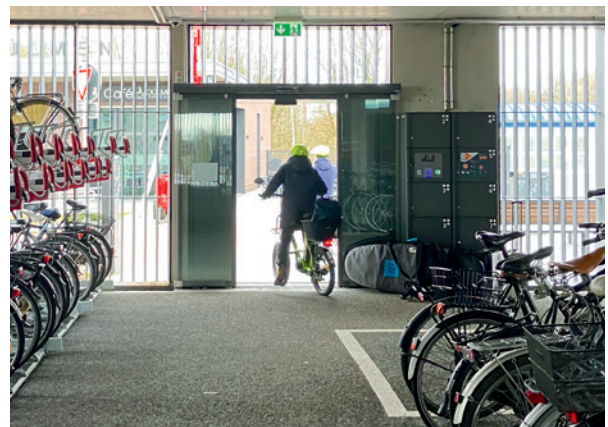
Abbildung 13: Automatische Glasschiebetür. Der benötigte Bauraum ist ca. doppelt so breit wie die lichte Durchgangsbreite.

Während für kleinere Anlagen mit weniger Nutzenden zu Spitzenzeiten pro Stunde (bis etwa hundert) automatisch öffnende Anschlagtüren oder Schiebetüren häufig ein gutes Verhältnis von Komfort und Sicherheit bieten, empfiehlt sich bei größeren Anlagen oder erhöhten Sicherheitsanforderungen eine Kombination verschiedener Türsysteme. Zur Vereinzelung bei gleichzeitig hohem Komfort und hoher Durchgangskapazität eignen sich insbesondere sogenannte Schiebedrehkreuze, bei denen die Türflügel seitlich wegfahren oder umklappen. Für erhöhte Sicherheit können diese z. B. mit automatischen Schiebetüren