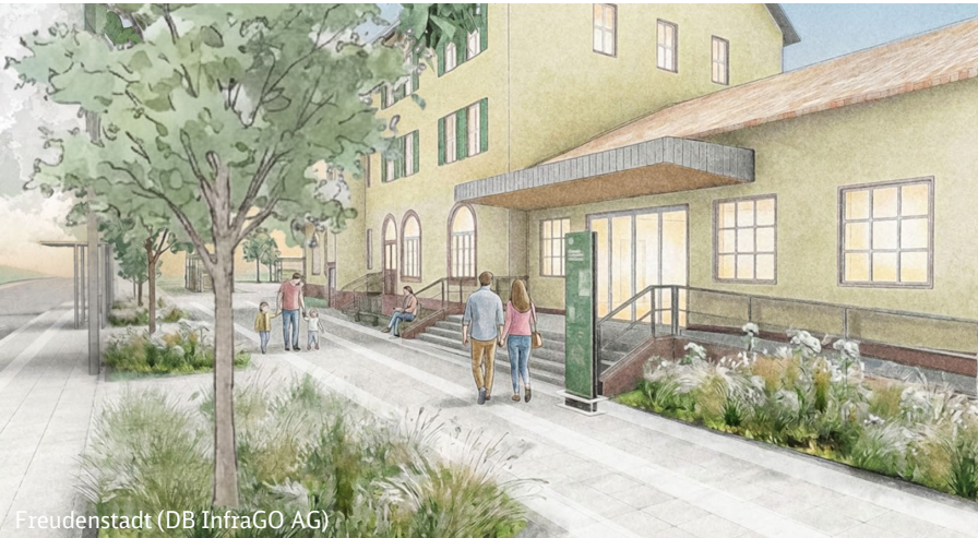
Freudenstadt (DB InfraGO AG)