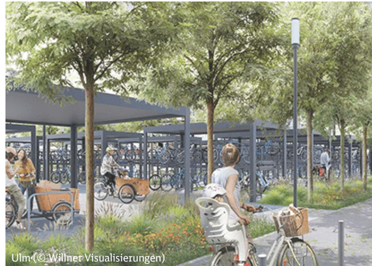
Ulm (© Willner Visualisierungen)