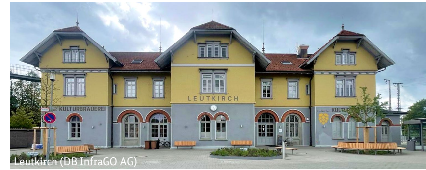
Leutkirch (DB InfraGO AG)