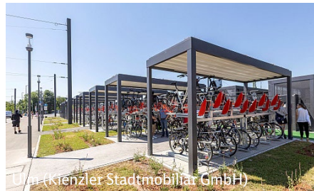
Ulm (Kienzler Stadtmobiliar GmbH)