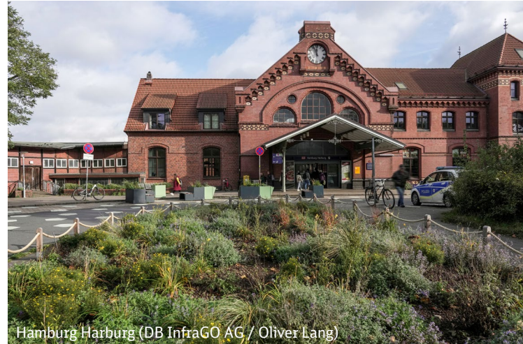
Hamburg Harburg