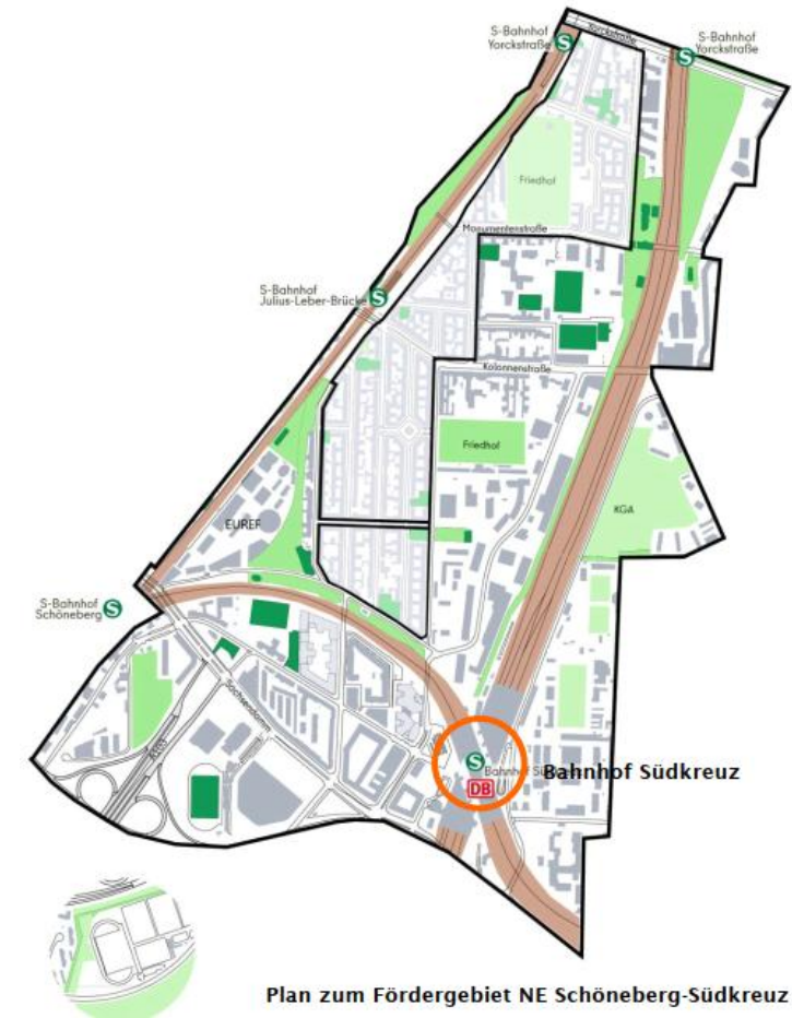
Plan zum Fördergebiet NE Schöneberg-Südkreuz